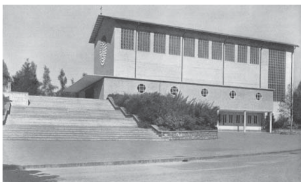
Kirche St. Josef 1941 kurz nach der Einweihung