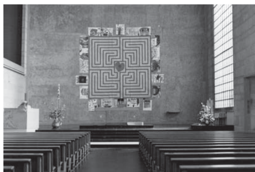
Gestaltete Wand Weisses Sonntag 1974